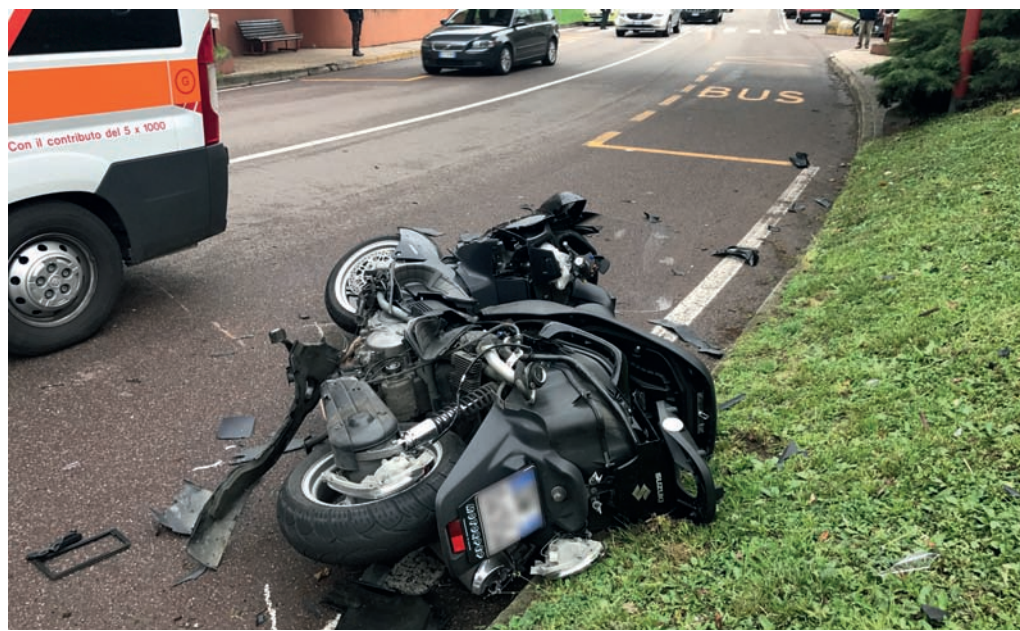
Via Fratelli Cervi Lo scooterone travolto mentre viaggiava sulla sua corsia sulla strada di spina di MI2