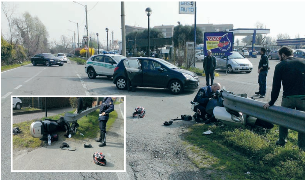
Rivoltana Qui sopra, la polizia locale di Segrate al lavoro per i rilievi dopo l'incidente avvenuto sulla Rivoltana, all'altezza dell'autolavaggio. Nel riquadro, lo scooter dopo lo scontro con l'automobile

NOVEGRO Ha riportato ferite guaribili in 20 giorni